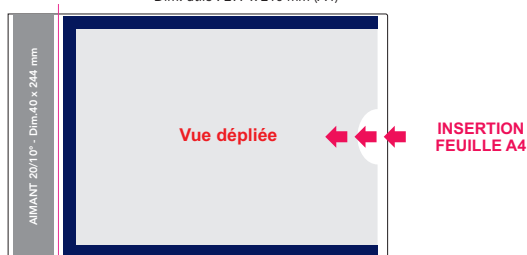
Plaques pour racks recto/verso avec porte-document A4 Dim. utile : 297 x 210 mm (A4)